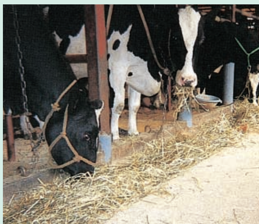
サイレージの採食風景 抜群の食い込み！