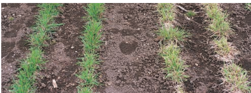
写真：オーチャードグラスの冬枯れ 左：北海道優良品種(フロンティア) 右：冬枯れに弱い導入品種

北海道優良品種は予備検定試験として3カ年、本検定試験として全道の6試験場で3カ年の試験が課せられ、その優良性が認められた品種です。すなわち全道の様々な環境に適応できる広域適応性品種であり、また、そのほとんどが海外導入によるものではなく、北海道の農業試験場や民間会社で育種された品種ですので、北海道の気象条件に最も適した品種といえます。草地更新には、安定多収の北海道優良品種をぜひご利用ください。