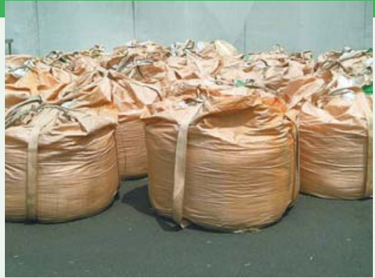
食品工場から搬出されたおからサイレージ

※粉のまま添加するタイプと、水に溶かして添加するタイプがあります。 ※養豚用発酵リキッドフィードの乳酸菌としても使われております。