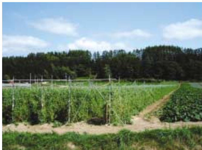
『華夏絹莢（はなかきめさや）』の栽培圃場

ため継続的に長期間の収穫が可能。 ・分枝数が少なく、樹が繁茂しづらい ため管理しやすく、また病虫害の発生も少ない。