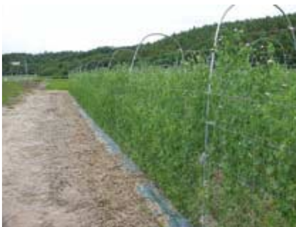
管理しやすい収穫期の『華夏絹莢（はなかきぬさや）』