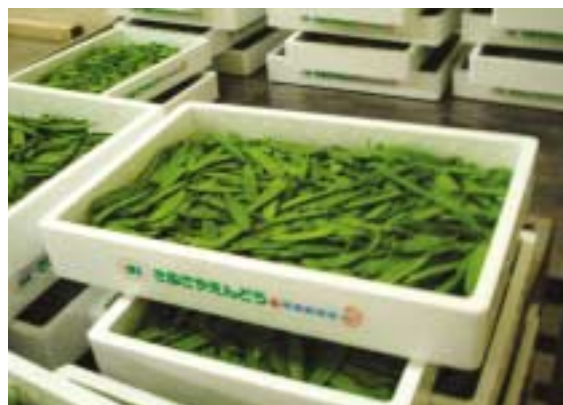
予冷中の『華夏絹莢（はなかきめさや）』

ヤナセ農園のキヌサヤエンドウは7月～8月中旬に収穫し、主に関東方面に出荷されます。栽培は他の作物と同様に畑作りから収穫まで徹底されたマニュアルの下、管理されています。特に莢の食感と色合いにこだわり、やわらかで鮮やかな色の莢に仕上げるた