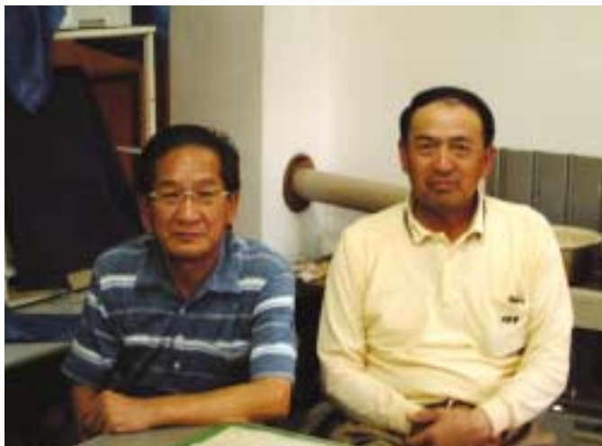
ヤナセ農園の左：柳瀬社長と右：柳瀬常務