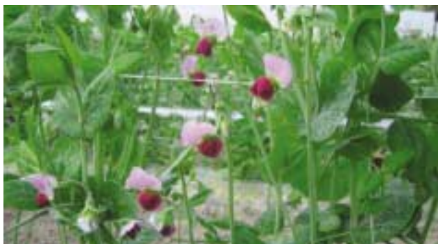
赤い花が特徴の『華夏絹莢（はなかきぬさや）』