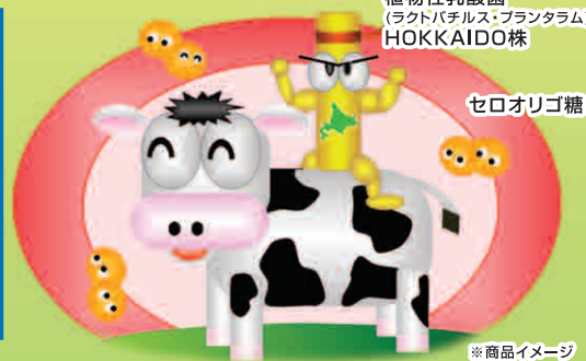
植物性乳酸菌 (ラクトバチルス・プランタラム) HOKKAIDO株