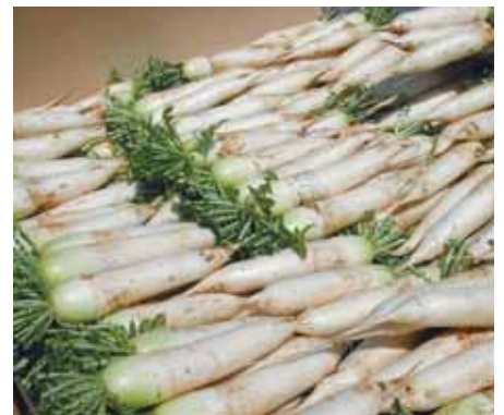
▲ 根形は春風太と良く似ている