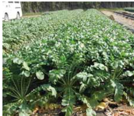
▲ 極晩抽性で葉がおとなしく良く揃う