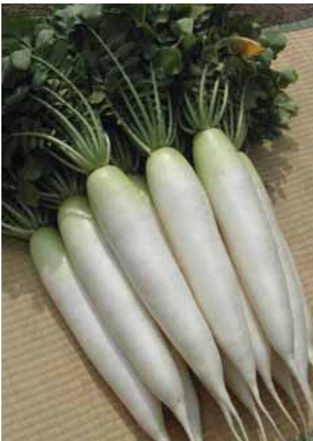
▲ 抜き易く、きれいに揃う「春省武」