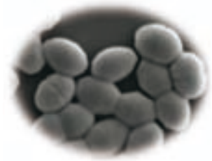
ラクトコッカス・ラクティス SBS0001株の電子顕微鏡写真