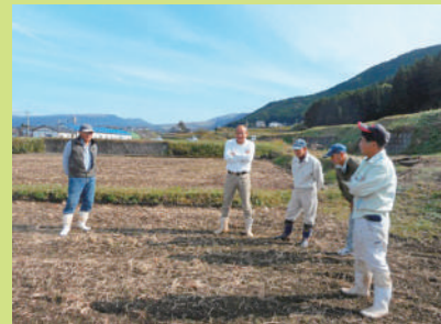
生産者と弊社営業マンがヘアリーベッチの発芽状況を確認しながら「現地」で意見交換!