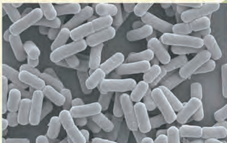
Lactobacillus diolivorans SBS0007株の電子顕微鏡写真

ラクトバチルス Lactobacillus diolivorans SBS0007株は、 弊社が国内のサイレージから分離・選抜した乳酸菌株です。