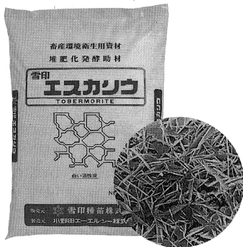
エスカリウの電子顕微鏡写真