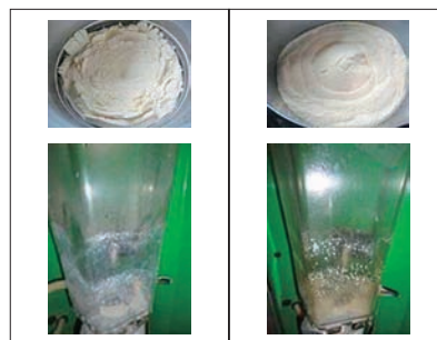
図3. 哺乳ロボット内での代用乳の物性状況 (左 他社代用乳 右 まるまるみるく)

下痢・軟便による治療を実施した回数も他社代用乳を上回らず、消化が良い結果が確認されています。